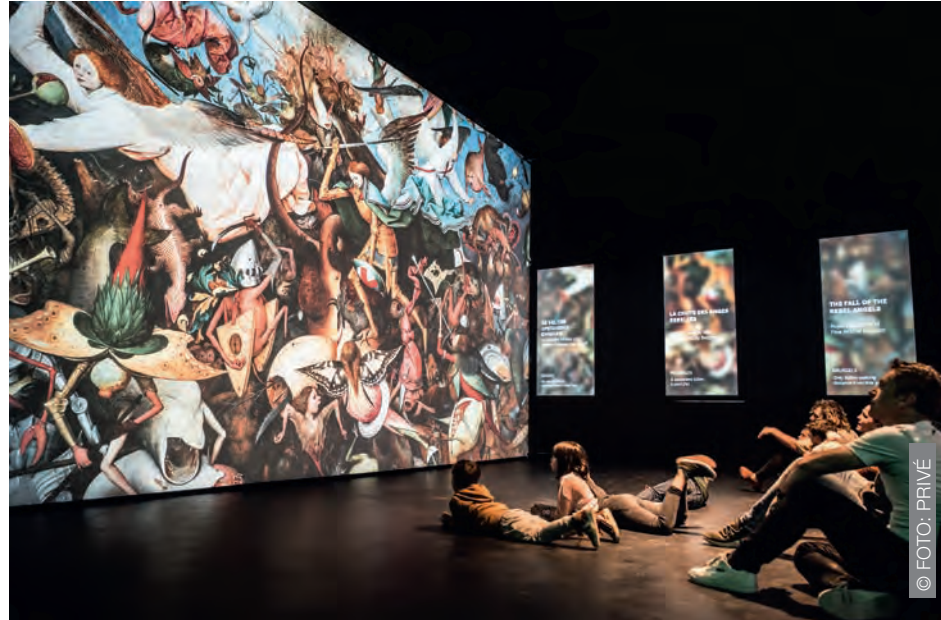
▲ Beyond Bruegel laat jong en oud op een mooie, toegankelijke, kwalitatieve en tastbare manier kennismaken met de schilder.

“Pieter Bruegel de Oude is een van de belangrijkste kunstenaars van de Nederlandse en Vlaamse renaissanceschilderkunst. Zijn wereld en manier van schilderen zijn dan ook ongehoord intrigerend. De tijdloze werken zijn rijk aan details, lagen, speelsheid, humor en verschillende (suggesties van) betekenissen. Dankzij Bruegels ongeremde verbeelding en