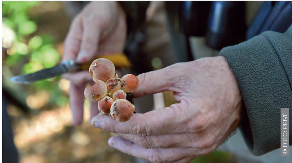
▲ Op 14 september wordt er in Vielsalm een champignonwandeling georganiseerd. Samen met een natuurgids kan je dan allerlei soorten champignons ontdekken.

De Hoge Ardennen zijn de ideale bestemming voor een kortverblijf tijdens het verlof