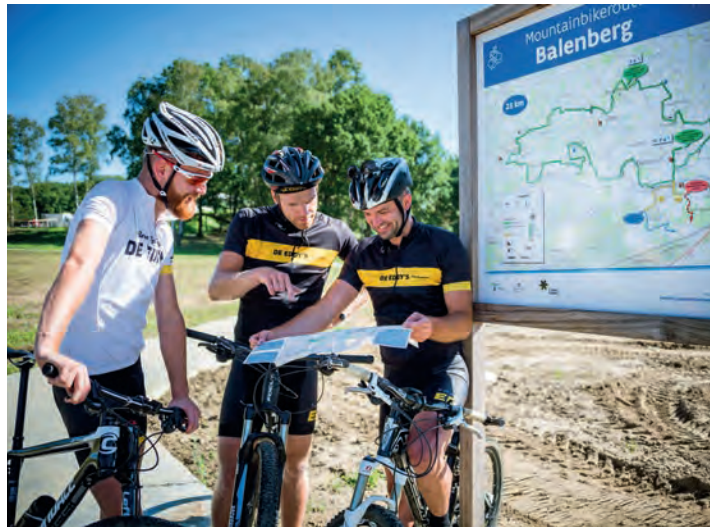
▲ Tegen de flanken van de Balenberg werden verschillende offroad fietsparcours aangelegd en afgebakend.

“Tegen de flanken van de Balenberg werden verschillende offroad fietsparcours aangelegd en afgebakend, waaronder het veldritpar-